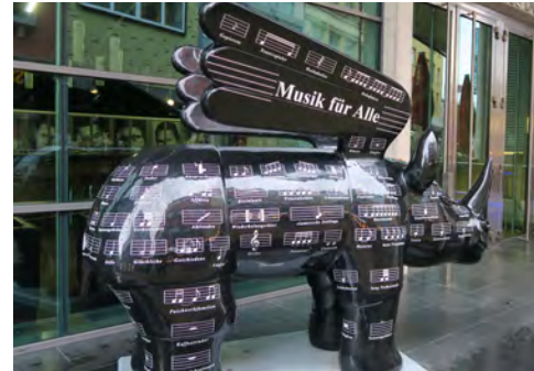
(公演写真)