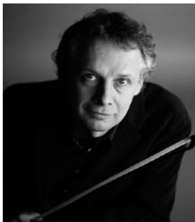
現代最高峰のチェリスト、 ウイスベルウエイ