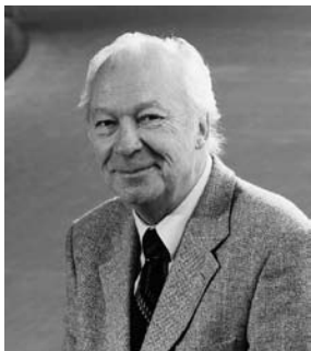
フィンランド作曲界 の泰斗、サリネン